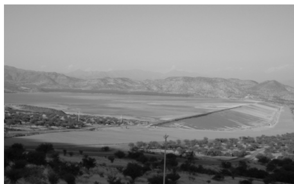
Abb. 1: Tailing der chilenischen Kupfermine.

Die Errichtung des Wetlands (Abbildung 4) erfolgte unter ständiger Begleitung der BioPlanta federführend durch das Bergbauunternehmen.