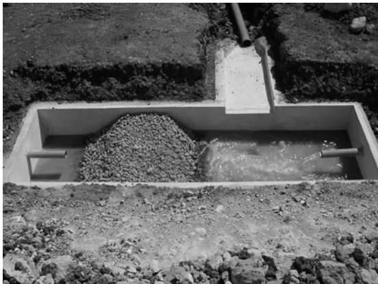
Abb. 4: Constructed Wetland der Kupfermine in Chile.