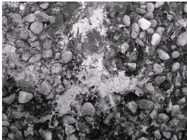
Abb. 3: Kiesoberfläche nach ca. 160 Tagen.