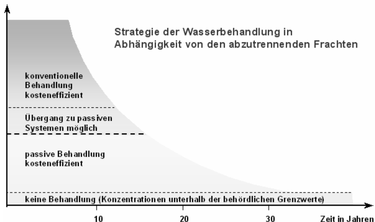
Abb. 1: Effizienz konventioneller und passiver Wasserbehandlungssysteme.

Mittel- bis langfristig wird von einer Aufrechterhaltung behandlungsrelevanter Stoffkonzentrationen ausgegangen. Der zum stabilen Betrieb der Wasserbehandlungsanlage Pöhla erforderliche