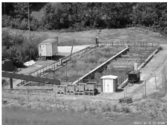
Abb. 3: Ansicht der Pilotanlage Pöhla.