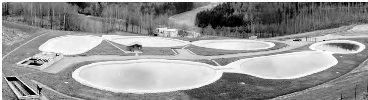
Abb. 5: Großtechnisches Constructed Wetland.

Die spezifischen Kosten für die Behandlung von Grubenwasser werden in der Anfangsphase, in der biologische Prozesse noch keinen Beitrag zur Schadstoffabtrennung liefern, ca. 1 \text{ €}\cdot\text{m}^{-3} betragen. Sie werden auf unter 0,2 \text{ €}\cdot\text{m}^{-3} sinken, wenn die in den Becken 2, 3 und 4 stattfindenden biologischen Prozesse, die Leistungsfähigkeit erreicht haben, die im Pilotversuch nachgewiesen werden konnte.