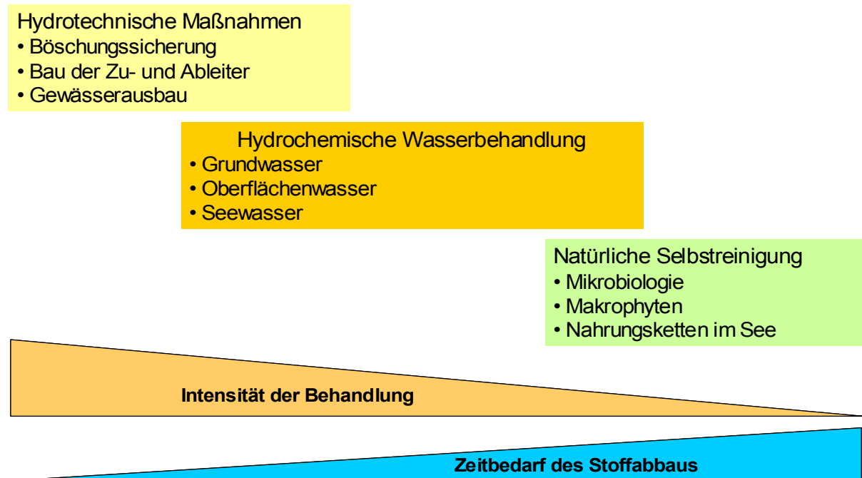
Abb. 3: Maßnahmen zur Beeinflussung der Beschaffenheit

fenheit zu erreichen. Durch die schnelle Flutung werden potentiell saure, aciditätsreiche Zuflüsse reduziert. Die nun in das Gebirge gerichtete Strömung wirkt stabilisierend auf die Böschungen und vermindert den zusätzlichen Eintrag durch die Erosion. Das Einleiten von Oberflächenwasser aus der fließenden Welle mit Nährstoffen wie Phosphor und Stickstoff begünstigt den chemisch-biologischen Neutralisationsprozess im See. Zur schnellen Flutung mit Oberflächenwasser gibt es zur Zeit keine wirtschaftliche Alternative. Was zur Gütesteuerung mit Oberflächenwasser nicht erreicht werden kann, muss durch zusätzliche technische Maßnahmen ausgeglichen werden.