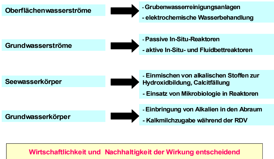
Abb. 4: Behandlungsverfahren Gewässerbeschaffenheit

wasserbehandlung durch Einbringen von Neutralisationsmitteln mittels Rüttelstopfverdichtung. Weiterhin wird das Einbringen von Kalkprodukten bei der geotechnisch notwendigen Massenumlagerung getestet, um die Auswirkungen auf Sedimentbildung, die Kolmation sowie die Besiedlung durch Flora und Fauna zielgerichtet auswerten können.