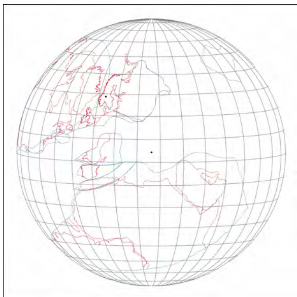
Abb. 1: Ausgangssituation 380 Ma.

SCOTESE C.R. (1998): Palaemap-Project. – www.scotese.com